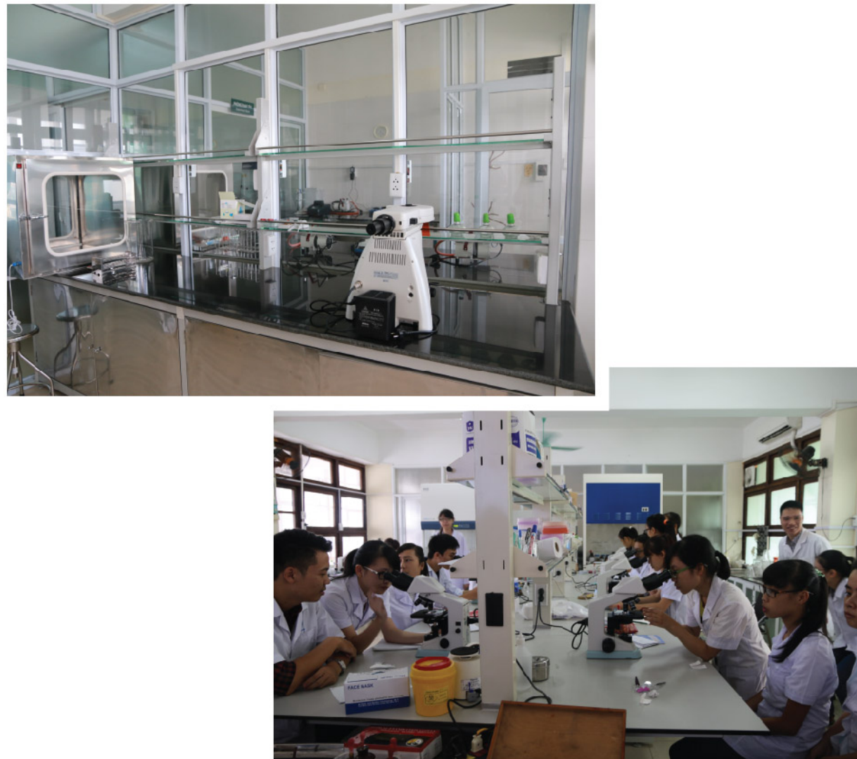
Trung tâm xét nghiệm của Trường ĐHYTCC được trang bị đầy đủ các thiết bị hiện đại phục vụ sinh viên CNXN YHDP

Nhà trường đang trong quá trình đăng ký tiêu chuẩn ISO cho Trung tâm xét nghiệm.