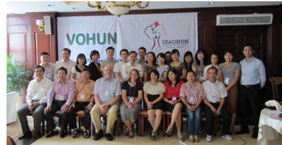
Ảnh 3: Khóa học về viết đề cương dự án của VOHUN tại Đà Nẵng tháng 8-2013

Trong khuôn khổ dự án FBLI và dự án PigRisk của trung tâm CENPHER, Trường Đại học Y tế công cộng đã kí biên bản ghi nhớ với 4 trường đại học tại Châu Á là: Đại học Mahidol (Thái Lan), Đại học Quốc gia Indonesia (Indonesia), Đại học Y Côn Minh (Trung Quốc) và Trường Đại học Rakuen Gakuno (Nhật Bản). Ngoài ra, dự án Mạng lưới các trường Đại học Một sức khỏe tại Việt Nam (VOHUN) cũng là cầu nối giữa Đại học Y tế công cộng và các trường đại học trong khu vực và quốc tế.