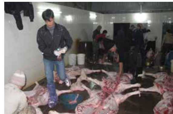
Ảnh 1: Hoạt động thu thập mẫu tại lò mổ ở Hưng Yên - một trong hai địa bàn nghiên cứu của Dự án PigRisk

Đánh giá nguy cơ là phương pháp đánh giá khoa học về mức độ của một nguy cơ cụ thể, từ đó đưa ra các biện pháp khác nhau để kiểm soát nguy cơ, được các nước phát triển sử dụng và áp dụng hiệu quả vào phát triển chính sách. Dự án “Giảm thiểu nguy cơ sức khỏe và tăng cường an toàn thực phẩm trong chuỗi giá trị chăn nuôi lợn quai mô nông hộ tại Việt Nam” (dự án PigRisk) sử dụng phương pháp đánh giá nguy cơ để xác định các mối nguy trong an toàn thực phẩm, đặc biệt là liên quan đến chuỗi giá trị sản xuất thịt lợn. Phương pháp này đã nhận được sự chú ý của các nhà hoạch định chính sách ở hai Bộ Y tế và Nông nghiệp và Phát triển nông thôn. Các hoạt động phổ biến kết quả nghiên cứu và phương pháp đánh giá nguy cơ đã thu hút sự chú ý của cộng đồng khoa học, các bộ ngành, và đặc biệt là Ngân hàng thế giới (World Bank) tại Việt Nam.