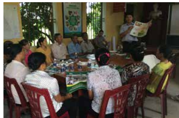
Ảnh 2: Nông dân tham gia vào thảo luận nhóm đóng góp cho mô hình can thiệp của nghiên cứu về quản lý chất thải người và động vật tại Hà Nam - một điểm mới mà nghiên cứu Sức khỏe sinh thái mang lại.

Dự án Sáng kiến xây dựng và phát triển sức khỏe sinh thái ở Đông Nam Á (FBLI) được triển khai ở tỉnh Hà Nam với mục tiêu là áp dụng cách tiếp cận Sức khỏe sinh thái (Ecohealth) để quản lý tốt hơn chất thải chăn nuôi và chất thải con người, nhằm nâng cao sức khỏe cho người và động vật. Cách tiếp cận Ecohealth là cách tiếp cận toàn diện, nhìn nhận sức khỏe từ khía cạnh con người, động vật và môi trường trong một hệ thống sinh thái xã hội. Cách tiếp cận Ecohealth đang nhanh chóng cùng với cách tiếp cận Một sức khỏe (One Health) tìm hiểu các vấn đề sức khỏe một cách toàn diện. Đây cũng là một nghiên cứu xuyên ngành - một xu hướng nghiên cứu mới có sự tham gia rất tích cực của chính quyền địa phương và của người dân cùng với các nhà chuyên môn ở các lĩnh vực khác nhau, như Y tế, chăn nuôi, Thú y, môi trường, xã hội và kinh tế.