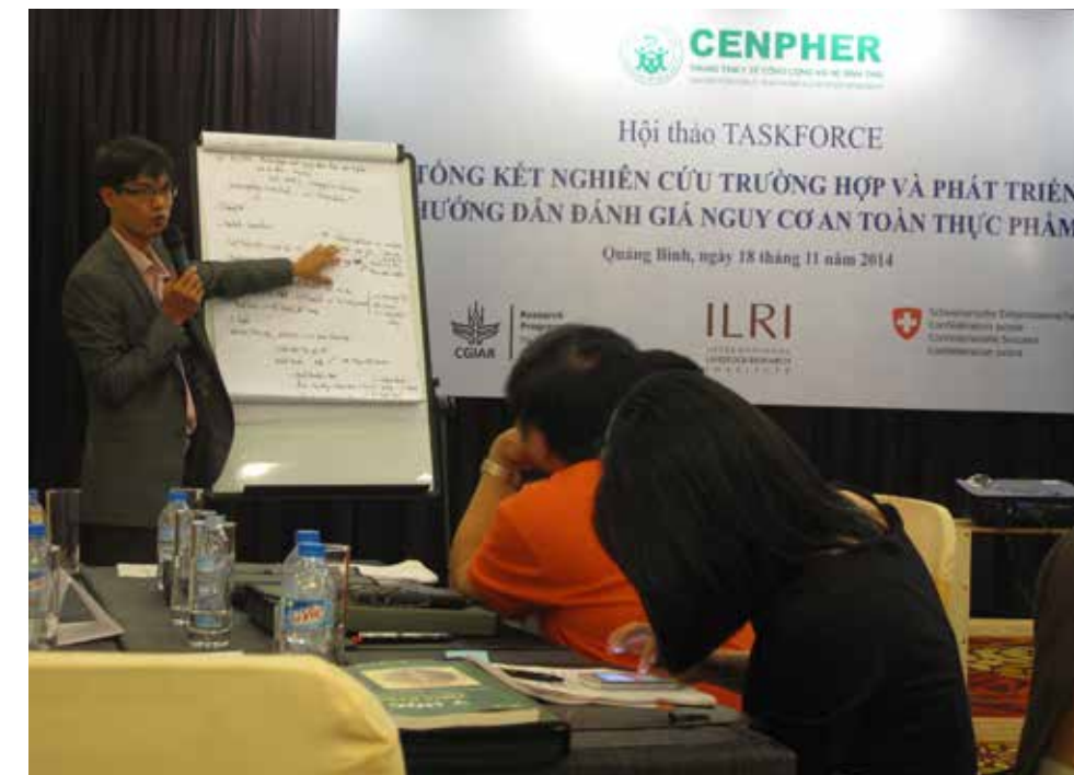
Ảnh 4: Hội thảo nghiên cứu trường hợp của nhóm TASKFORCE tại Quảng Bình, tháng 12-2014

Trung tâm CENPHER luôn lồng ghép các yếu tố liên quan đến vận động chính sách không chỉ ở bước cuối cùng khi đã có các kết quả mà kết nối các nhà hoạt động chính sách ở Bộ Y tế và Bộ Nông nghiệp và Phát triển Nông thôn cùng thảo luận, góp ý cho hoạt động ở các giai đoạn cũng như xác định nhu cầu trong việc sử dụng kết quả nghiên cứu. Nhóm Hành động về Đánh giá nguy cơ (gọi tắt là TASKFORCE) là hoạt động kết hợp thường niên của nhóm nghiên cứu với các chuyên gia về an toàn thực phẩm ở hai bộ nói trên.