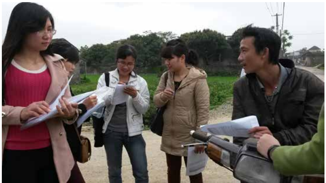
Ảnh 5: Sinh viên, học viên cao học của Trường Đại học Y tế công cộng đang tham gia một hoạt động nghiên cứu tại địa bàn xã Hoàng Tây, tỉnh Hà Nam

Dự án nghiên cứu Sáng kiến xây dựng và phát triển Sức khỏe sinh thái ở Đông Nam Á (Field Building Leadership Initiative – FBLLI) đã lồng ghép các hoạt động nghiên cứu tại thực địa là các xã trên địa bàn tỉnh Hà Nam, giúp học viên cao học, nghiên cứu sinh có cơ hội thực hiện