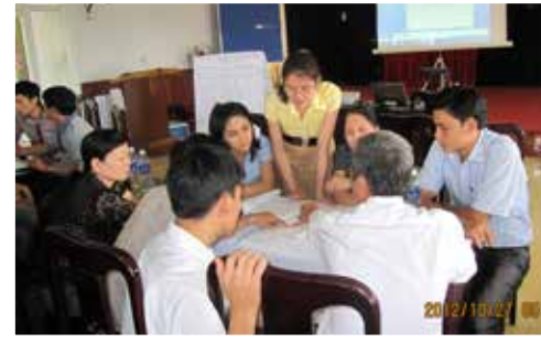
Áp dụng phương pháp dạy học tích cực trên lớp.

Sau khi hoàn thành các khóa đào tạo chính quy (Thạc sĩ Quản lý bệnh viện, Thạc sĩ Y tế công cộng) và các khóa học đào tạo liên tục về quản lý, nhiều học viên đã được bổ nhiệm các vị trí quản lý, lãnh đạo quan trọng tại các đơn vị trong hệ thống y tế. Các học viên của nhiều khóa học ngắn hạn (Quản lý chất lượng toàn diện, Quản lý dự án...) đã rất tâm đắc và ứng dụng được nhiều kỹ năng, công cụ quản lý được học trong công việc thực tế của mình.