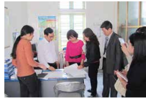
Hướng dẫn học viên ứng dụng nội dung các khóa học quản lý tại cơ sở y tế.